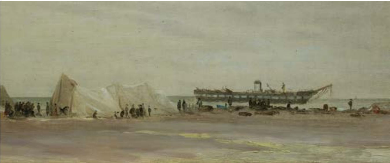
Maleri fra redningen af Alexander Nevskij. På stranden er der telte til de mange reddede ting. Til højre i billedet står en vagt med gevær. Privat eje.

Strandfogeden skulle sørge for, at dem der blev reddet fik et sted at bo. Hvis nogle var druknet, skulle han opbevare de døde, til de kunne blive begravet.