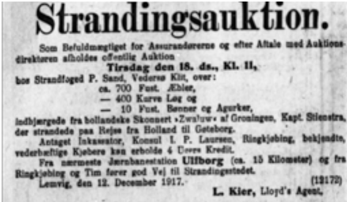
Avisannonce for strandingsauktion