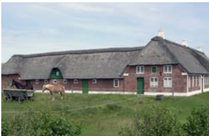
Abelines Gård ved Hvidesande var tidligere strandfogedgård. I dag er det museum

Når et skib strandede, var der meget, der skulle gøres og mange, der havde en opgave. Først skulle rednings-folkene forsøge at redde dem, der var ombord. De fleste blev reddet, men der var også nogen, som druknede.