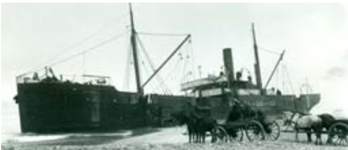
Bjergelav i gang med at tømme det svenske skib Hermod.

De ting, der blev reddet, blev ofte solgt på auktion. Pengene blev brugt til at betale alle dem, der hjalp til. Hvis der blev penge til overs, så skulle skibets ejere have dem.